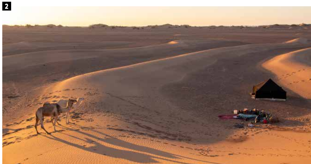
1 Op en naast de weg kom je ogen te kort. Overbeladen voertuigen vormen geen uitzondering. 2 In de schaduw van een hoge duin slaan we onze tent op. Straks slapen we onder de sterren in de Sahara. 3 Schommelen op een dromedaris. Rondom ons niets dan zand.