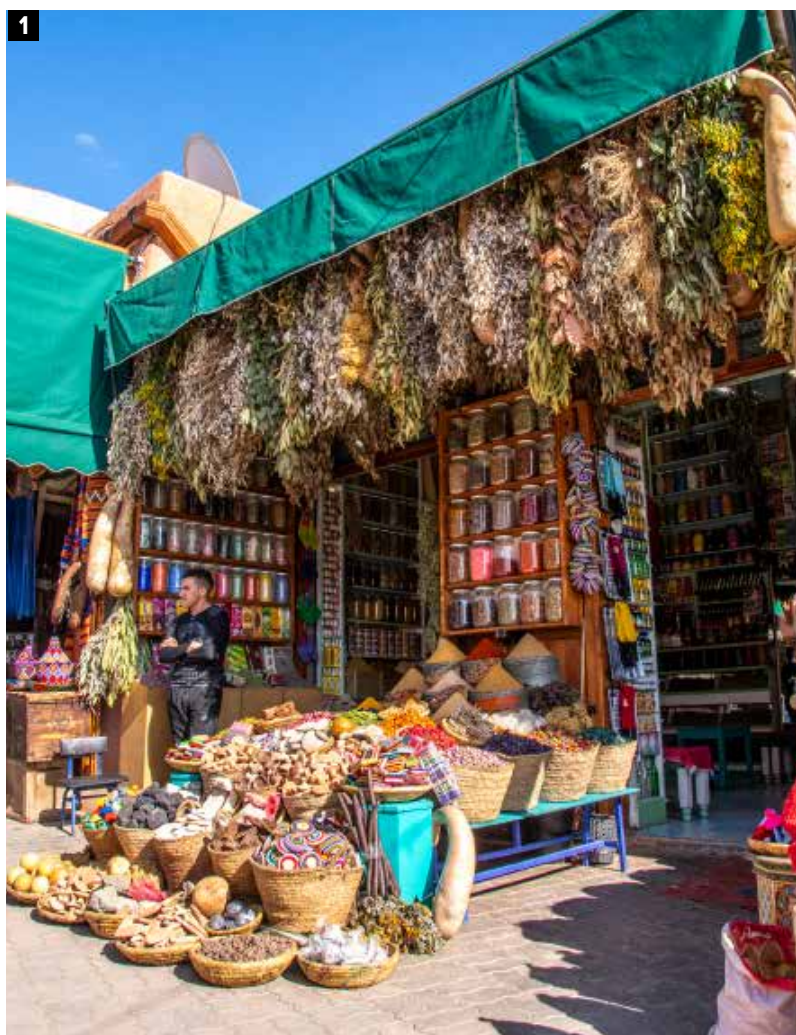
1 In de soeks worden we overweldigd door de geuren en kleuren. 2 Marokko vanuit de lucht: een magische ervaring.

We rijden richting Dadèskloof, die met de Todrakloof wedijvert om de titel van interessantste en bekendste stukje Zuid-Marokko. Hier geen hordes dagjesmensen, het grootste stuk van de Dadèsrivier staat dan ook droog en biedt geen verkoeling. Onder een staalblauwe hemel liggen akkers en boomgaarden in het dal en een roodachtig geërodeerd rotsgesteente met fascinerende vormen siert de achtergrond. Het smalste en indrukwekkendste stuk ontdekken we na Aït Oudinar, de weg klimt in lussen omhoog naast een afgrond van meer dan honderd meter diep. Onze camper neemt de bochten gezwind, af en toe knijp ik m'n ogen dicht en hoop ik dat we geen tegenligger kruisen. Ook hierboven gaat het majestueuze uitzicht samen met een ijskoude wind. 'Die wind? Die voel je als het regent in het noorden', bromt Mohammed, eigenaar van de groezelige camping waar we vannacht logeren.