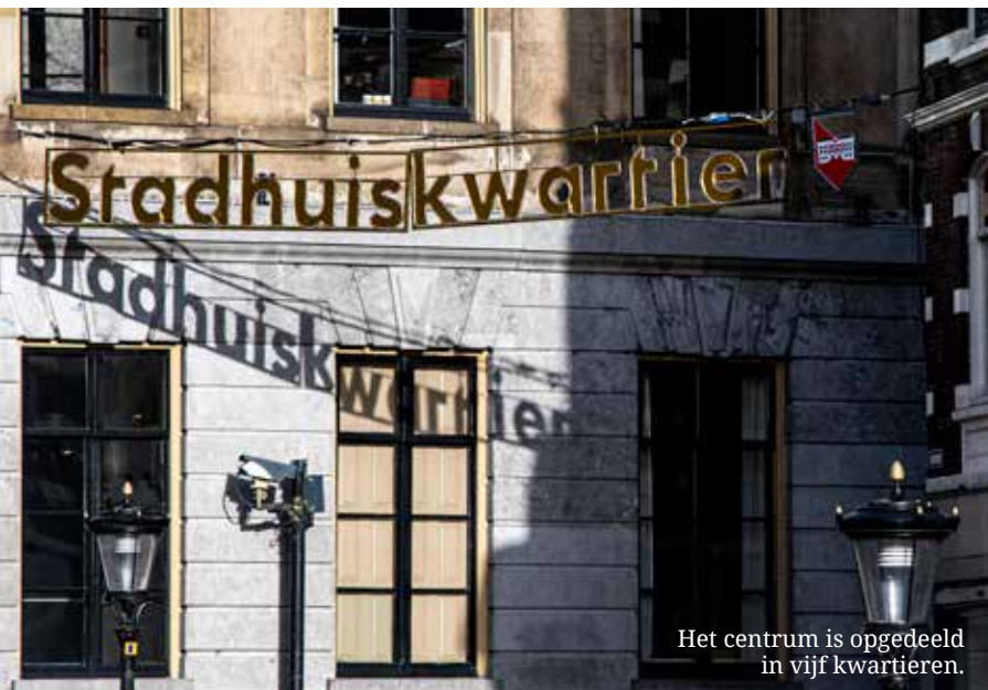
Het centrum is opgedeeld in vijf kwartieren.