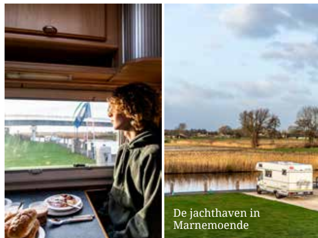
Wegdromen tussen ontbijt en boten.