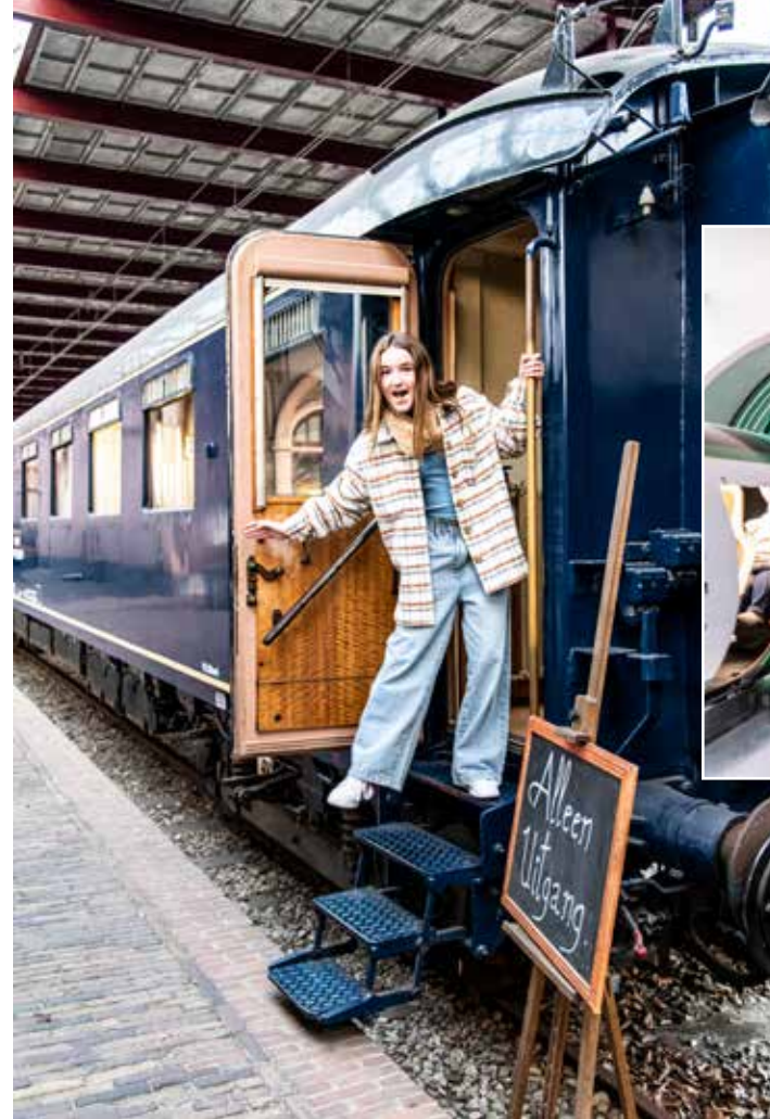
Vintage treinen spotten in het Spoorwegmuseum

bemachtigen we een tafeltje op het terras bij Anna Pancakes. De keuze aan hartige en zoete pancakes is zo groot, ik lust ze allemaal wel. Mijn keuze valt op de Bavarian appel met warme kaneelappeltjes, brownie, aardbei en ahornsiroop en poedersuiker. Dit zoete stapeltje brengt me een stuk sneller in hemelse sferen dan de beklimming van die hoge toren. Zelfs onze druktemakers zijn stil aan tafel. Zijn ze nog moe van de inspanning of is het gewoonweg te lekker? Na hun suikershot zitten ze terug vol energie en doorkruisen we de stad richting het leukste station van Nederland. Ook het Spoorwegmuseum is geen slaapverwekkend museum, maar een fascinerende plek voor groot en klein waar we ontdekken hoe de komst van de trein de wereld veranderde. Terwijl de zoon fan is van het techlab met de boeiende proefjes en bewonde-