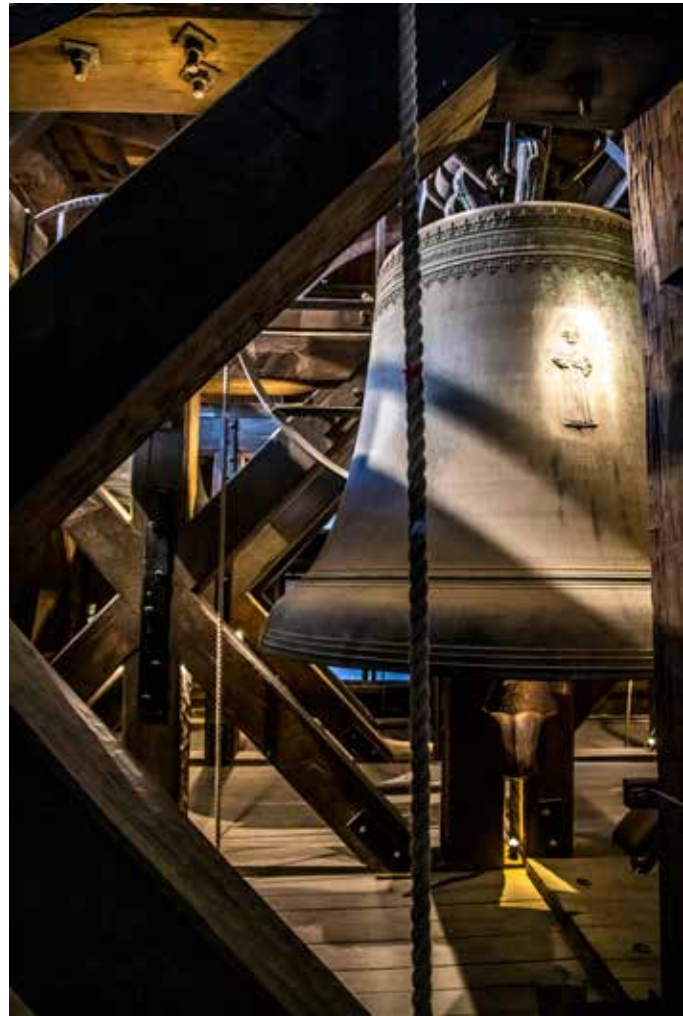
De Domtoren: het icoon van Utrecht en een straffe beklimming