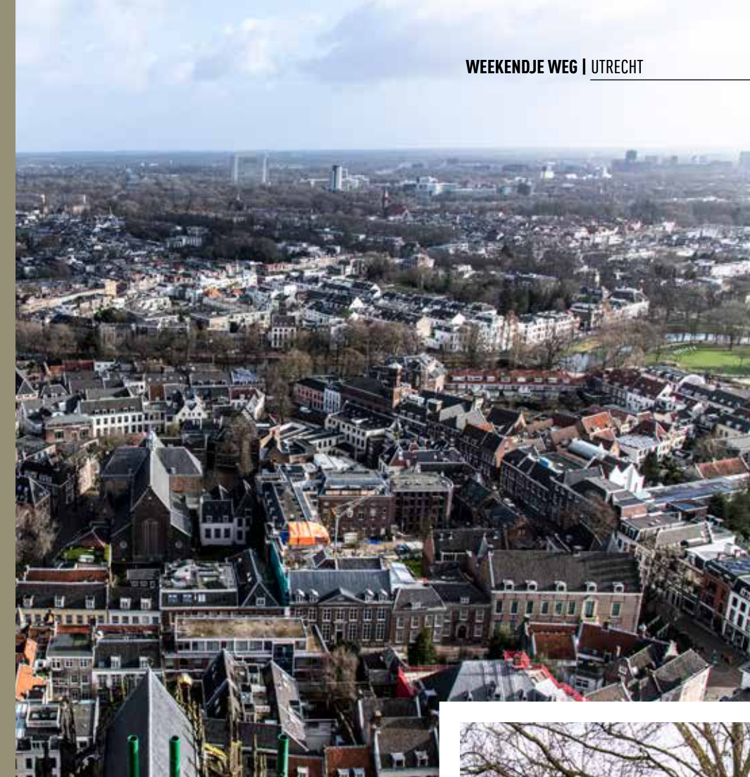
De beloning na 495 treden: een prachtig uitzicht

wonder dat alle klokken samen maar twee keer per jaar te horen zijn. Ook ons staat nog een stevige work-out te wachten, om te genieten van het prachtige uitzicht moeten we eerst 495 treden bedwingen, die alsmaar smaller worden. Het duizelt me op het uitkijksplatform, al ben ik niet zeker of dat door de hoogte of door mijn slechte conditie komt.