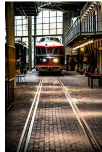
Het Spoorwegmuseum: het leukste station van Nederland

rend kijkt naar het schaalmodel van de Hyperloop, vallen bij de dochter vooral de vintage ingerichte treinen en de spannende attractie Stalen Monsters in de smaak. We gillen en lachen uitbundig terwijl het karretje ons in het donker rondtoelt en we bijna op een aankomende trein botsen. Op de terugweg duurt het geen tien minuten of de jongste is op weg naar dromenland. Hopelijk is het snel weer weekend om te kunnen uitrusten.