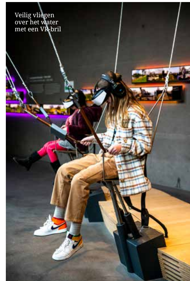
Veilig vliegen over het water met een VR-bril