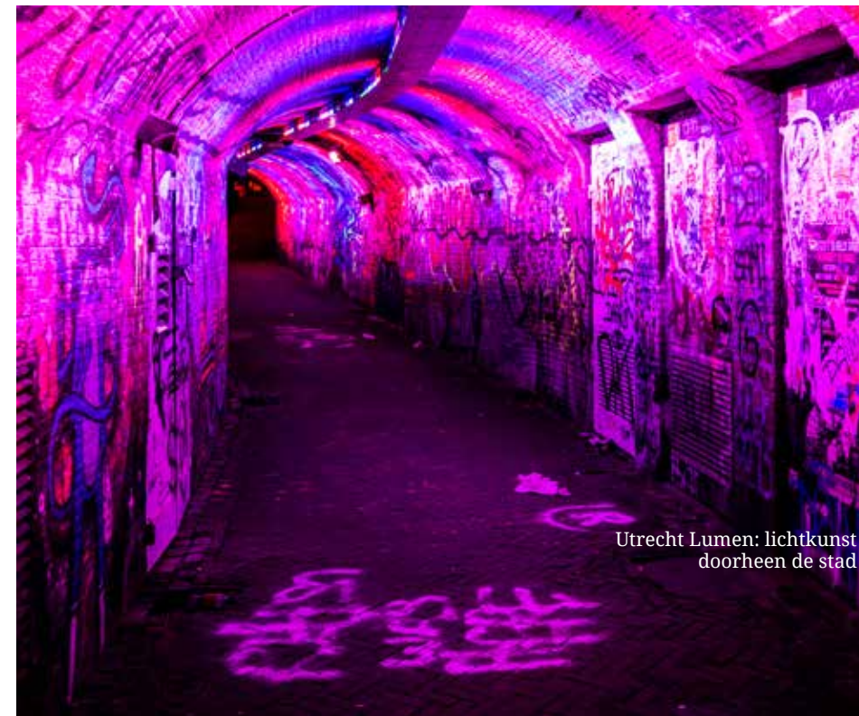
Utrecht Lumen: lichtkunst doorheen de stad

elk kwartier vallen er koopjes te doen. Als de avond valt, verleggen we onze aandacht naar de stralende kunstwerken die de stad verlichten. Utrecht Lumen bestaat uit tientallen lichtkunstwerken doorheen de stad, die je te voet of met de fiets kan ontdekken. Onze stappenteller slaat stilletjes aan tilt, maar de lokroep van de lichtpareltjes is groot. Gelukkig brengen de neon rebus aan het station en de felverlichte letters IK ons over de Moreelsebrug tot bij Uncle Jim, waar we onze vermoeide voetjes gewillig onder tafel schuiven. Uitgeteld tuffen we naar onze plek voor de nacht. De camperplaats aan de jachthaven in Marnemoende ligt er idyllisch bij, zelfs in het donker. We slapen als roosjes.