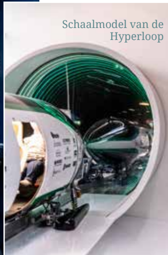
Schaalmodel van de Hyperloop