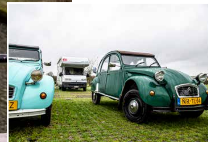
TEKST KELLY MORTELMANS

Brood en wijn Er is geen file, op de radio speelt een lekker muziekje en ik neurie vrolijk mee. Last minute probeer ik nog een tafeltje te bemachtigen bij een van de restaurantjes in de