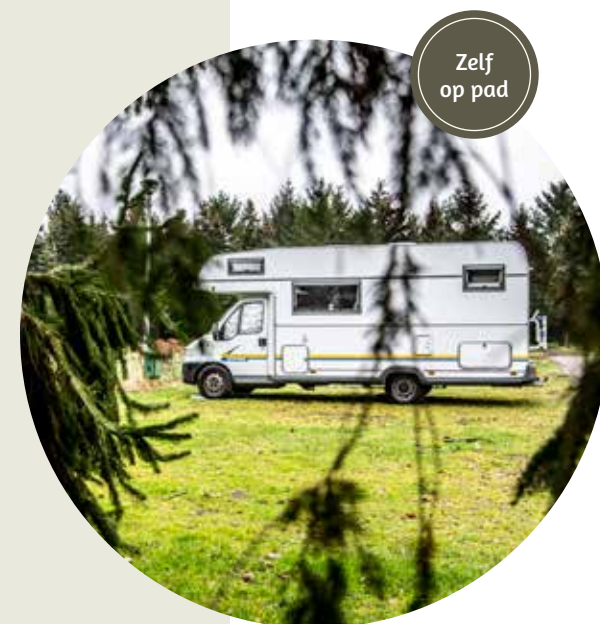
Zelf op pad

3 Buitengoed De Boomgaard buitengoeddeboomgaard.nl Waar? Parallelweg 9, 3981 HG Bunnik Prijs: laagseizoen in het weekend € 25 Pluspunten: • avontuurlijk buitenspeel terrein voor kinderen • Op fietsafstand van de stad • Ruim opgezet in een groene omgeving • Station op 10 minuten wandelen Minpunten: • in het hoogseizoen minder geschikt voor rustzoekers