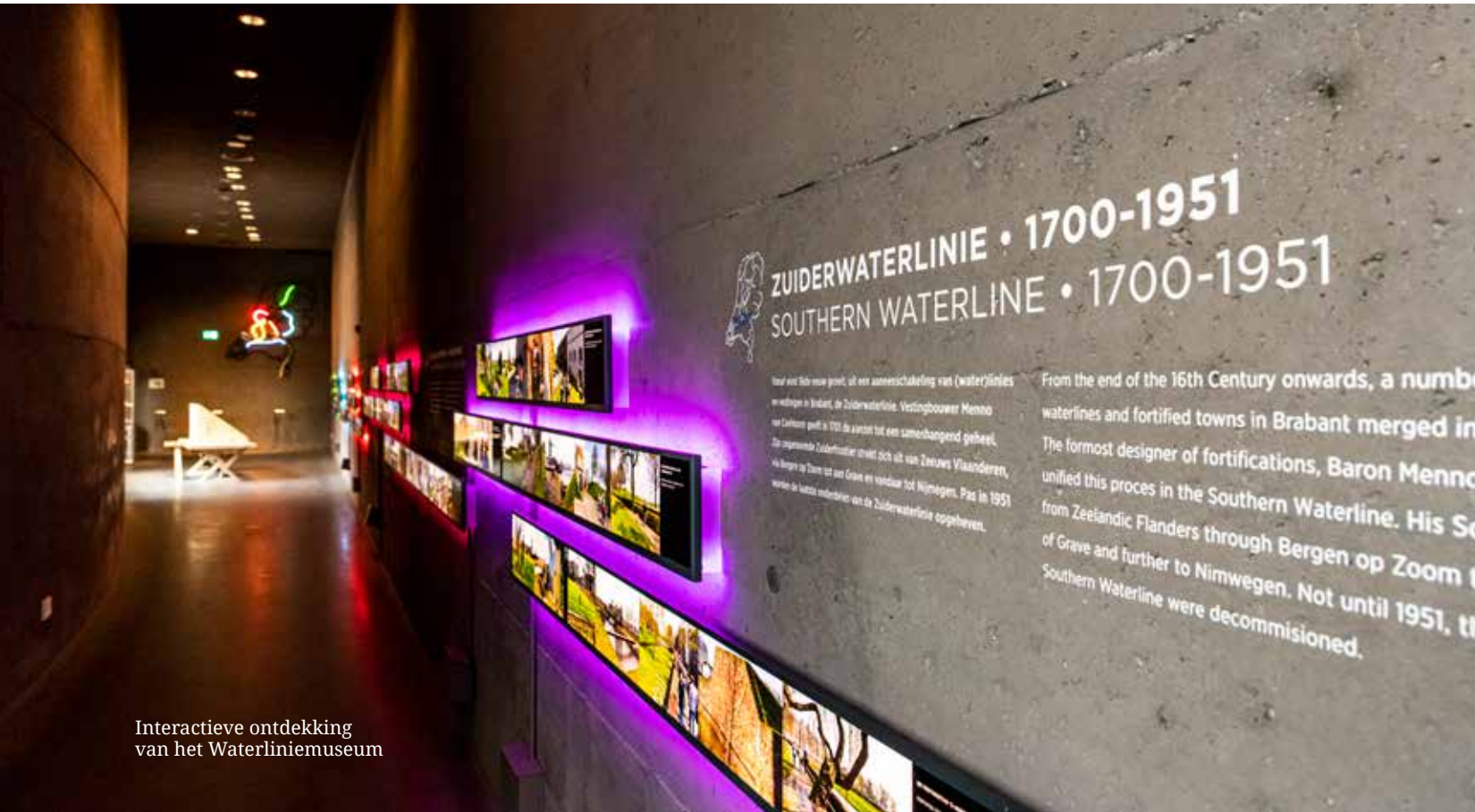
Interactieve ontdekking van het Waterliniemuseum