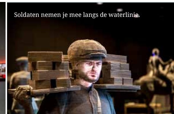
Soldaten nemen je mee langs de waterlinie.