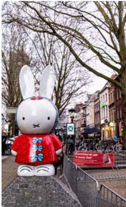
Utrecht is de thuisstad van Nijntje. Het kinderboekfiguurtje van Dick Bruna is vaak te spotten in de winkelstraten.

Terug met beide voetjes op de grond en nog knikkende knieën van de inspanning, besluiten we dat het tijd is voor iets lekkers. Het is zondag en dan mag er gesnoept worden. Alleen zijn we niet de enigen die dat bedachten, heel Utrecht lijkt op de been en alle koffiebars en knusse brunchplekjes worden overstroomd. Gelukkig