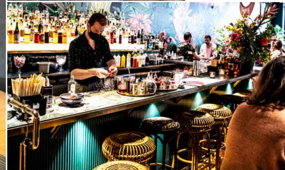
Wereldkeuken in The Streetfood Club

buurt van onze camping, dat blijkt niet zo eenvoudig. De lockdown in Nederland is net afgelopen en iedereen wil uit eten. Gelukkig scoor ik nog een tafeltje bij een Grieks restaurant op tien minuutjes rijden. Vino e pane (zo heet het restaurant), meer heeft een mens niet nodig om het weekend goed in te zetten.