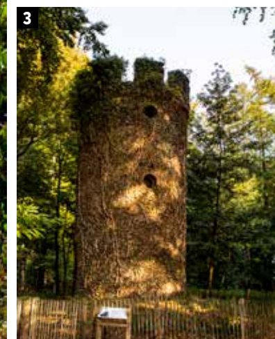
2 Op de IJsmolenhoeve wachten een klimmuur en heel wat andere spannende avonturen. 3 De Geuzentoren lijkt wel uit een sprookje ontsnapt.