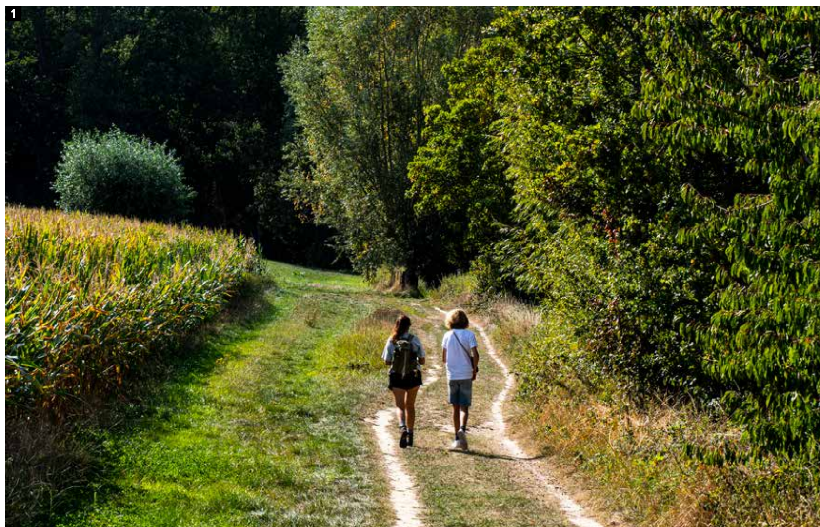
1 Wat is het heerlijk rustig in en rond Ename.

Benieuwd of zijn lyrische omschrijving klopt, duiken wij het Muziekbos in. Hoewel het geritsel van de bladeren als muziek in onze oren klinkt, komt de naam van het woordje ‘muz’ - Keltisch voor moeras. We zetten er stevig de pas in en klauteren de Muziekbos op, een getuigenheuvel van 148 meter hoog, en genieten van het magnifieke bos, dat baadt in een warme gloed. Onze wervelwinden ravotten erop los: ze klauteren op omgevallen bomen, strooien met bladeren en hollen de glooiingen op en af. Een klimmetje op de sprookjesachtige Geuzentoren zit er niet in, alleen met een begeleide wandeling mag je erop. Ik vlij me dan maar languit op de Sinnenbanken , een prachtig vormgegeven rustbank, om van het uitzicht te genieten. Met de zonnestralen op mijn gezicht en de wind in mijn